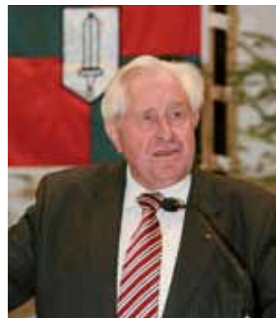
Prof. Dr. Bernhard Vogel