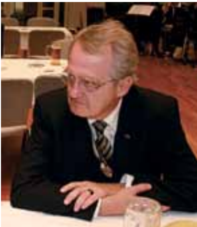
Vbr. Rainer Wieland, Vizepräsident des Europaparlaments